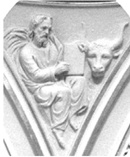
In der Kapelle genommenes Foto

Der freudreiche Rosenkranz kreist um diese Freude der Menschwerdung. In der Szene der Verkündigung sagt der Engel Gabriel zur Jungfrau von Nazareth: «Freu dich, Maria». Freude erfüllt auch die Begegnung Marias mit Elisabeth. Noch mehr ist die Geburt des göttlichen Kindes in Bethlehem in eine Atmosphäre der Freude eingetaucht.