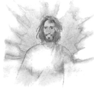
Auferstehung Matthäus 28, 5-6

Lichtzeichen : Maria, Morgenröte einer neuen Welt.