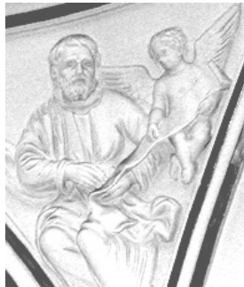
In der Kapelle genommenes Foto

Die Betrachtung des Antlitzes Christi kann nicht beim Bild des Gekreuzigten anhalten. Er ist der Auferstandene! In den glorreichen Geheimnissen feiern wir den Triumph Christi über die Mächte der Finsternis. Der heilige Matthäus, einer der zwölf Apostel, zuvor Zöllner, beschreibt genau die Lebensgewohnheiten in Palästina und zitiert sehr oft das Alte Testament, um zu zeigen, dass Jesus wirklich der erwartete Messias ist, der König der Juden, derjenige, der die Schriften erfüllt. Sein Symbol ist der Mensch, da er sein Zeugnis mit dem Stammbaum Jesu beginnt. Mit hohem pädagogischen Gespür schlägt er eine Katechese in wohlgeleiteten Kapiteln vor: fünf große Reden und die Passion. Mit dem Wissen, dass die Kirche das wahre Israel ist, lässt er sie als das Volk Gottes erkennen, das Frucht bringen wird. Wir erleben mit jenen, denen sich Christus gezeigt hat, wieder die Freude, auch die Freude Marias. Sie selber wird an der Herrlichkeit, in der Christus nach der Himmelfahrt zur Rechten des Vaters ist, durch ihre Aufnahme teilnehmen. Durch die Krönung wird sie zur Königin der Engel und der Heiligen. Im Zentrum dieses glorreichen Weges des Sohnes und seiner Mutter zeigt uns Pfingsten das Antlitz der Kirche als eine Familie, geeint um Maria, belebt durch die Ausgießung des Geistes und vorbereitet für die Sendung zur Evangelisation .