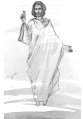
Lukas 24, 51