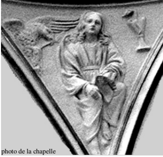
photo de la chapelle

Ici commence l'histoire de la Passion du Christ. Ces dix-huit heures terribles endurées par Jésus avant sa mort nous découvrent les profondeurs de l'amour de Dieu pour nous.