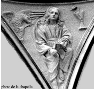
photo de la chapelle

Aquí comienza la historia de la Pasión de Cristo. Estas dieciocho horas soportadas por Jesús antes de su muerte nos descubren la profundidad del amor de Dios por nosotros.