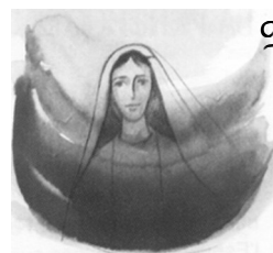
La Asunción de María