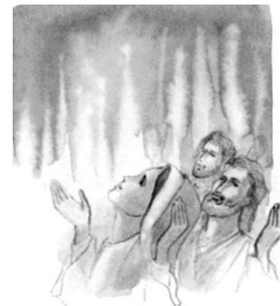
La Venida del Espíritu Santo Hechos 2, 1-4