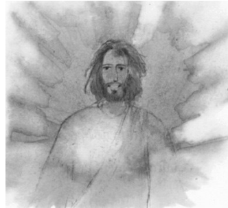
La Resurrección Mateo 28, 5-6