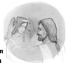
La coronación de la Virgen