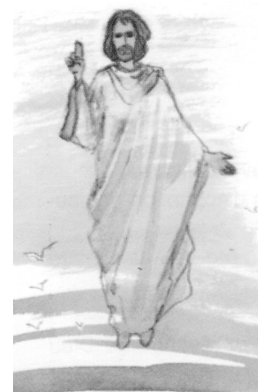
La Ascensión Luc 24,50-53